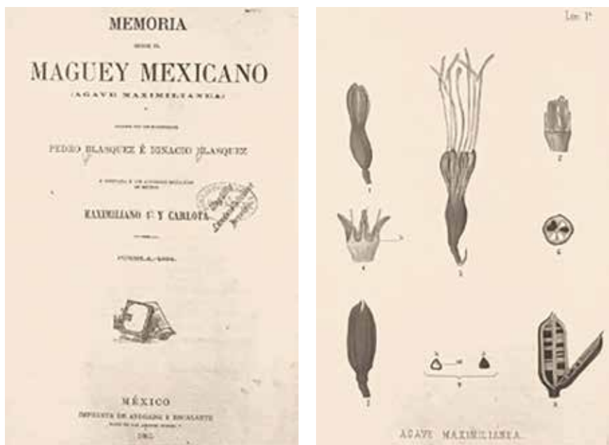
Figura no. 3 y 4

requiere para para su fermentación. 21 Ambos textos fueron precursores de una revelación empresarial de las posibilidades económicas en la explotación de los productos de los diversos agaves del país, que años después tendrían importancia para las otras industrias del mezcal, henequén y lechuguilla.